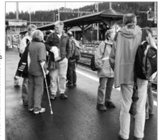
Ein letztes Warten auf den Zug