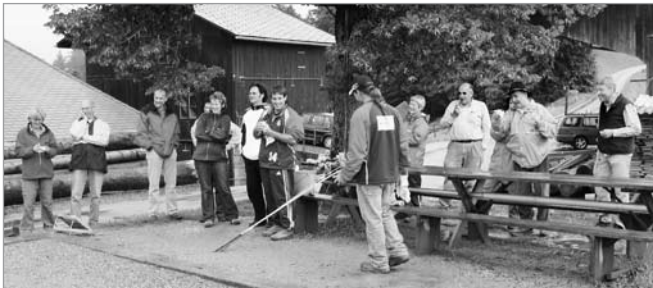
Theaterleute sind aufmerksame Schüler